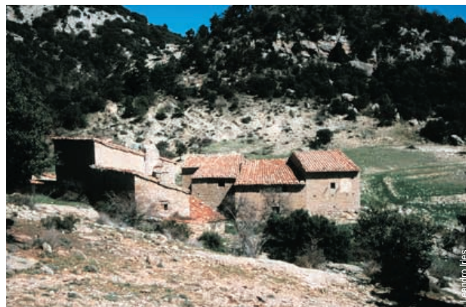
Mas de la Villalta