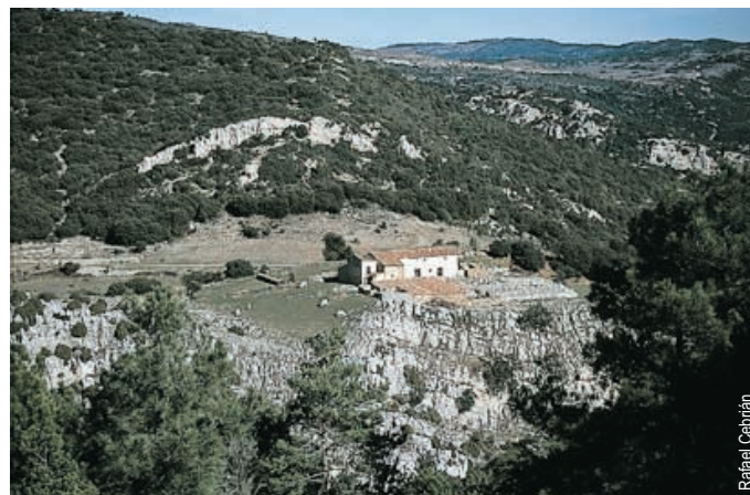
Mas de Sinfores, camino de Bel a Castell de Cabres